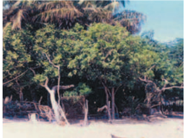
Figura 1. Se logró aislar Scytalidium dimidiatum de árboles de Mangifera indica (mango). La parcela se encuentra en la cercanía de la ciudad de Coro, en la zona semiárida del Estado Falcón (características climáticas: temperatura promedio anual mayor de 24 °C, precipitaciones hasta 600 mm/año, elevación del terreno hasta de 50 m sobre el nivel del mar).

Este coelomiceto podría considerarse un oportunista tanto para el hombre, como para algunas plantas tropicales, y se recomienda tener en cuenta el riesgo de infección en aquellos habitantes de edad madura dedicados al cuidado de plantaciones frutales de estas zonas costeras caribeñas, especialmente por su costumbre de calzar zapatos abiertos.