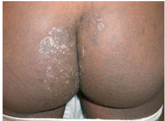
Figura 1. Placa descamativa de bordes mal definidos en glúteos (caso 1).

Igualmente, en el examen directo se apreciaron múltiples hifas septadas y ramificadas con abundantes arthroconidias. En ambas placas de Sabouraud crecieron pequeñas colonias rojo-violáceas de centro granular y bordes vellosos, de lento crecimiento, que podían recordar a T. violaceum (Figuras 4 y 5). Microscópicamente se observaban abundantes macroconidias de pared fina y lisa, en forma de cigarro y abundantes microconidias piriformes. Llamó la atención que en ambos casos las macroconidias germinaban a través de la celda terminal, produciendo apéndices a modo de cola de ratón, que en realidad eran hifas que producían microconidias (Figura 6). Este mismo fenómeno también se observó en celdas intermedias (Figura 7). Estas características morfológicas junto a un test de ureasa positivo, nos llevaron al diagnóstico de tinea glutealis por T. rubrum var. raubitschekii .