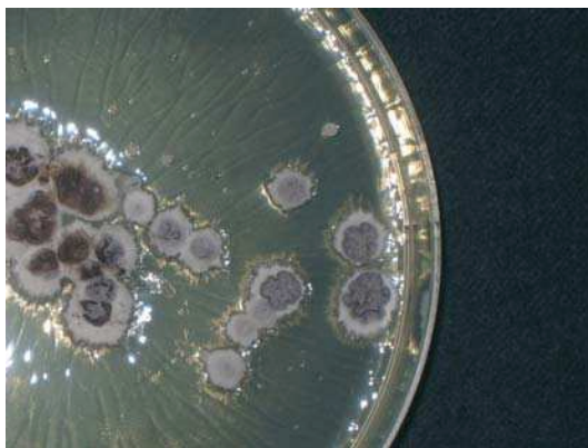
Figura 5. Colonias de Trichophyton rubrum var. raubitschekii en agar glucosado de Sabouraud (caso 2).