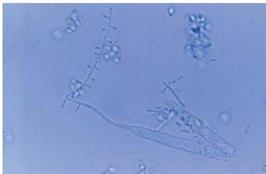
Figura 6. Examen microscópico de Trichophyton rubrum var. raubitschekii (caso 1). Tinción con azul de lactofenol (x1000).