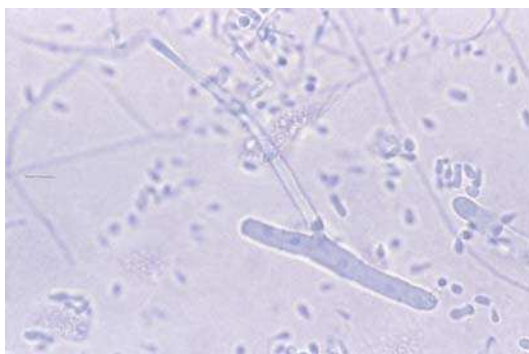
Figura 7. Examen microscópico de Trichophyton rubrum var. raubitschekii (caso 2). Tinción con azul de lactofenol (x1000).