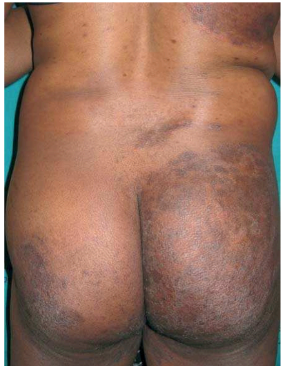
Figura 3. Afectación asimétrica de glúteos y región dorsolumbar (caso 2).