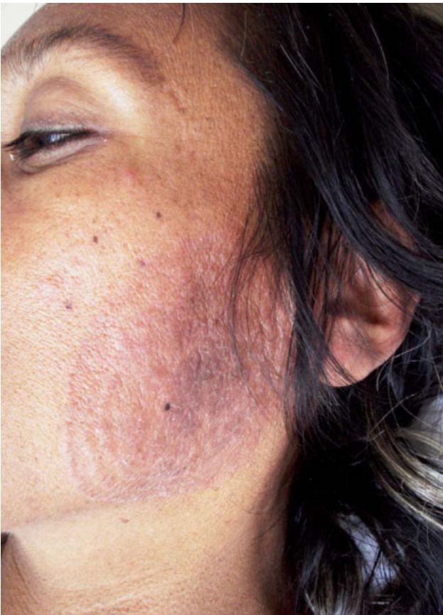
Figura 2. Lesión vesículo-escamosa del carrillo izquierdo.