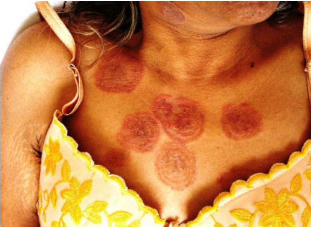
Figura 1. Lesiones cutáneas en la cara anterior del tórax mostrando varios arcos concéntricos de vesículas.