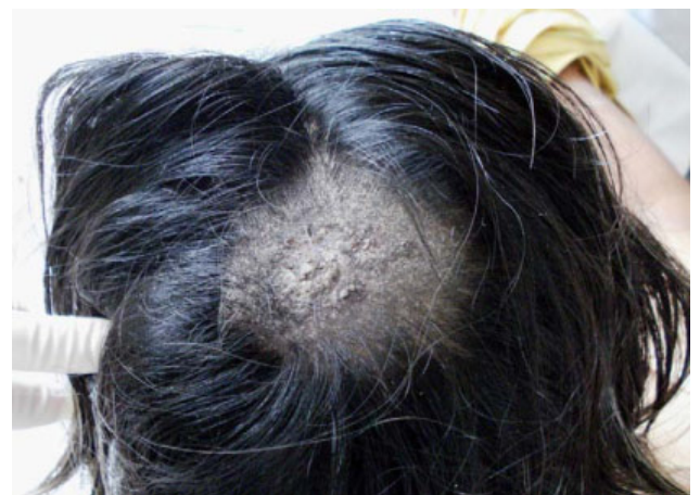
Figura 4. Lesión tonsurante del cuero cabelludo.