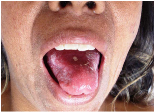
Figura 5. Seudomembranas blanquecinas en la mucosa oral.