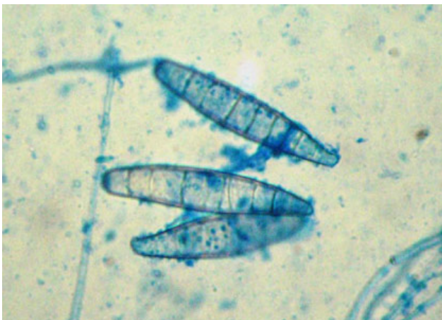
Figura 7. Examen microscópico de las colonias, azul lactofenol, x1.000.

El aspecto de las lesiones de la piel correspondía a las producidas por este microorganismo, con la presencia de arcos concéntricos de mayor actividad inflamatoria. La otra dermatofitosis capaz de producir un aspecto parecido es la tinea imbricata , cuyo agente causal es Trichophyton concentricum . Sin embargo, en este último caso los anillos son escamosos, y tanto el com-