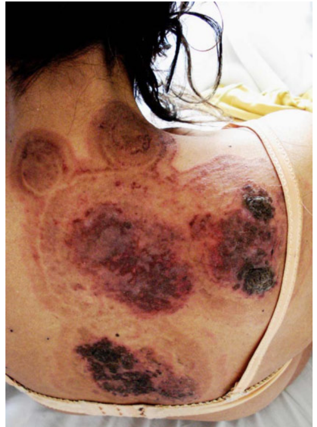
Figura 3. Placas cutáneas del dorso del tórax.

Presentaba un síndrome cutáneo, del cual nos ocuparemos más tarde, y, finalmente, un cuadro neurológico con desorientación témporo-espacial, pérdida de la memoria y más tarde ataxia y una paresia periférica. Se trataba de una encefalitis, sin compromiso meníngeo aparente.