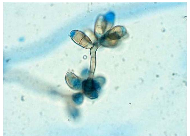
Figura 2. Conidióforo y conidios de Curvularia sp. (x400).

Los primeros reportes clínicos de RSC datan de la década de 1970 y principios de la de 1980. En 1978 Young et al 24 documentaron el caso de un nadador de 15 años con poliposis nasal, sinusitis de los senos etmoidal y maxilar y proptosis de ojo izquierdo debido a la propagación del hongo desde el seno a la órbita. En 1983, Katzenshtein et al 9 describieron la presencia de pólipos nasales junto con asma y una secreción localizada en los senos afectados. Se cree que el hongo al ser inhalado ocasiona un cambio antigénico inicial en la superficie de la mucosa nasal y, si éste permanece en la cavidad, se desencadenan reacciones alérgicas de tipo I (mediada por